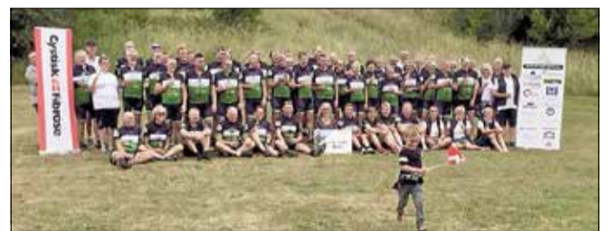
Tour de Sjælland har efter årets cykelløb, overrakt 150.000 kroner til Cystisk Fibrose foreningen.

Første etape gik til Skælskør, ad den sjællandske vestkyst, en tur på 168 kilometer. Anden dag gik turen til Haslev, en tur på 163 kilometer. Tredie dag var der