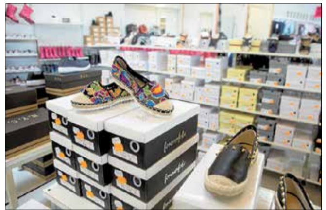
Skoene er tilbage på hylderne i Lagersalg.

Af andre nyheder fra Lagersalg, der efterhånden har eksisteret i 34 år, kan oplyses at der igen er sko (til hele familien)